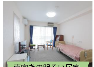
南向きの明るい居室

今回ご案内するお2人部屋は、南向きに面した28.26㎡の明るいお部屋です。 室内には介護ベッド、テレビ、テーブル、冷蔵庫など、生活に必要な家具が揃っておりますので、衣類や生活用品をお持ち頂ければすぐにご入居いただく事も可能です。