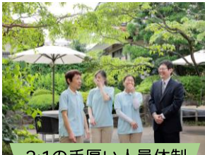
2:1の手厚い人員体制

小金井パーク・ヴィラは、24時間看護師が常駐しておりますので、昼夜問わず医療ケアが必要な方も安心してお過ごしいただけます。 また、24時間切れ目のない健康管理を行うことで、入居者様のADL向上を目指しています。