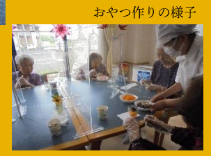
おやつ作りの様子