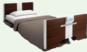
パラマウントベッド / エスピア離床CATCH

ヘルス・ケア・ヴィラ小金井公園では、より安心してお過ごしいただく為に、最新の設備を導入しています。居室での転倒を防止するために、センサー内臓の介護ベッドを導入。入居者様お一人おひとりに合わせた設定で、状態変化を把握。迅速に居室にお伺い出来るため、居室での事故低下に繋がっています。また、車椅子や寝たきりの方にご利用頂く機会浴槽はフルリクライニング機能搭載。肩までゆったり浸かれる水深と100%新湯方式で、気持ちよくご入浴いただけます。