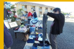
フリーマーケットの様子

ヘルス・ケア・ヴィラ小金井公園では、絵葉書や塗り絵、歌など定番のものから、フリーマーケットやおやつ作り、ハンドケアなど一風変わったものまで、多彩なレクリエーションをご用意しています。また、お手伝いレクでは施設内で使用する雑巾を縫っていただくなど、ADLに合わせた取り組みを行い、やりがいや達成感を感じていただいています。