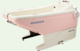
酒井医療 / カトレア